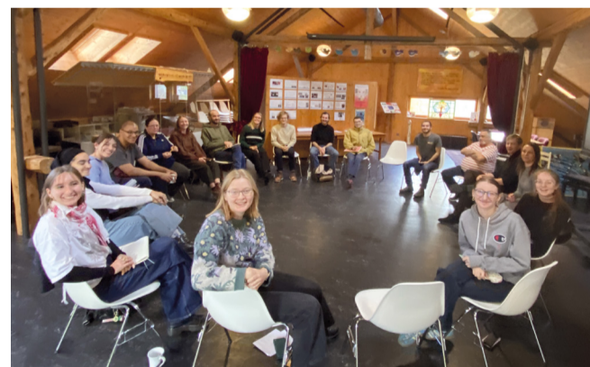
Rencontre Jeunesse à Treyvaux.

Nous allons nous donner la liberté d'échanger à partir de nos expériences de vie, nos savoirs et perspectives. Nous avons pour ambition d'unir nos courages et nos efforts pour gagner ensemble en pouvoir d'agir, pour réaliser des changements et... oser nos rêves !