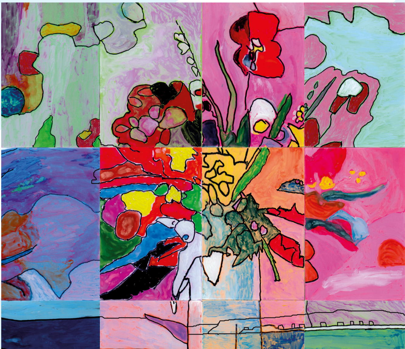
Une version artistique de l'action commune : On peint ensemble, œuvre collective réalisée à Landerneau (France), dans un atelier de création ATD.