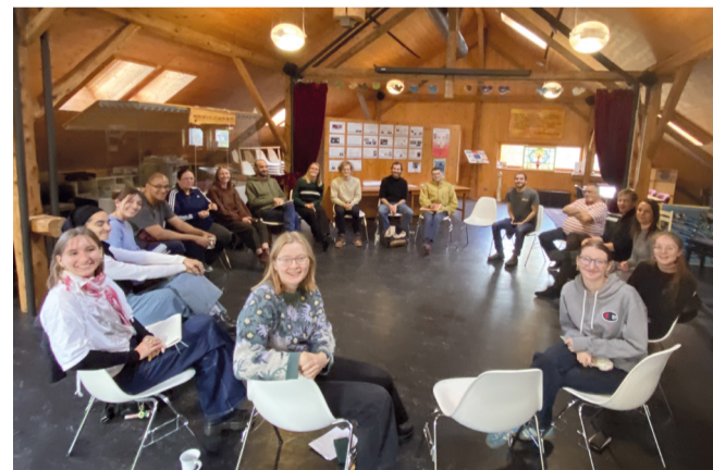
Jugend-Treffen in Treyvoux.