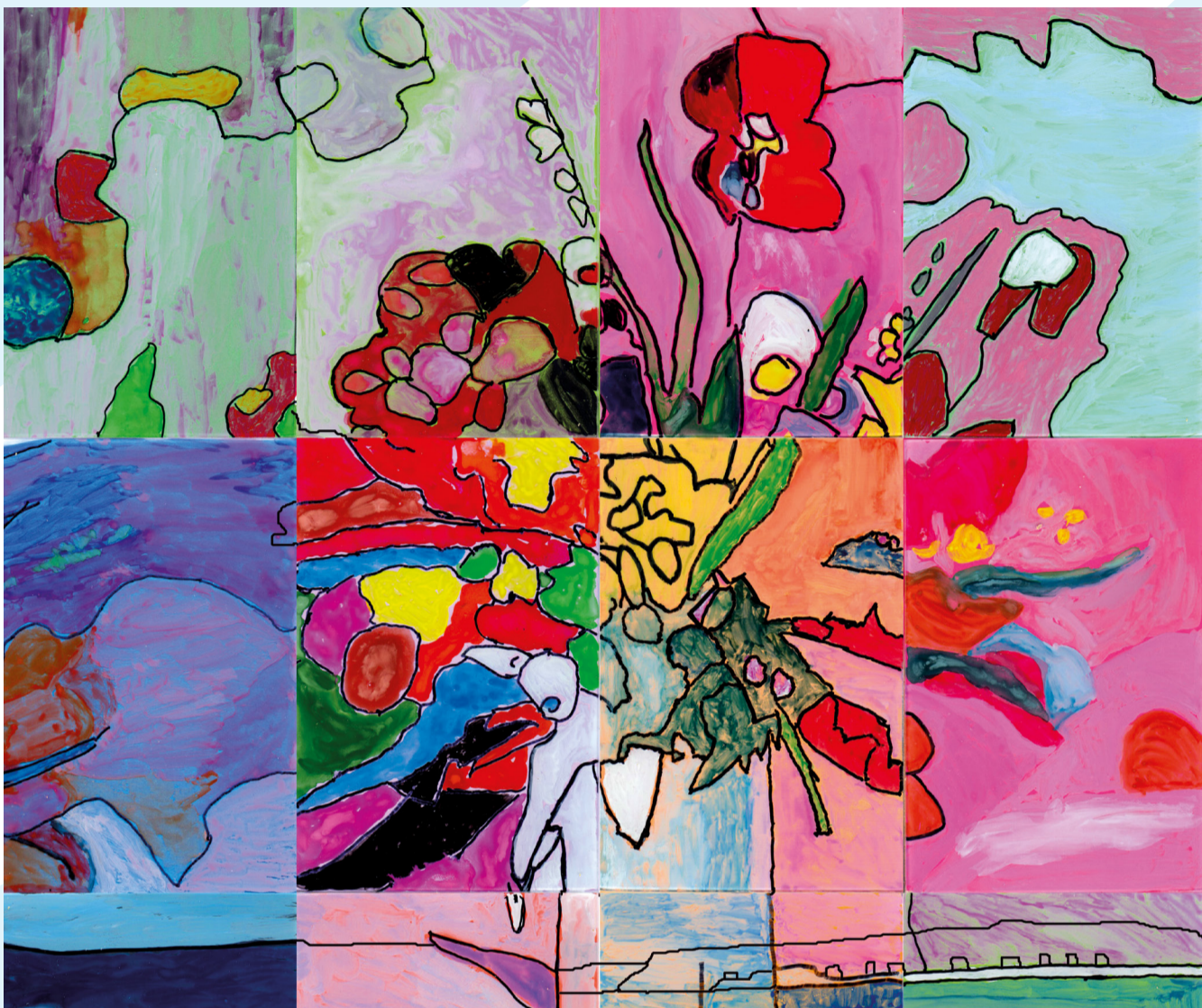
Eine künstlerische Umsetzung des gemeinsamen Schaffens: On peint ensemble, (wir malen zusammen), Gemeinschaftswerk, entstanden in Landerneau (Frankreich) bei einem ATD-Kreativworkshop.