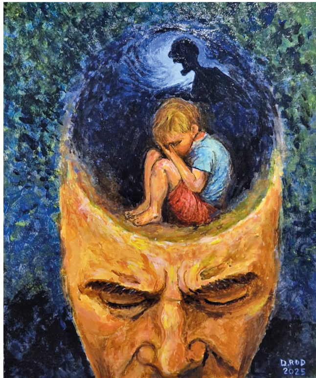
Eines der ausgestellten Werke: Trauma , Gemälde von Daniel Rod.

Meiner Meinung nach war es wichtig, dass die Künstler nicht nur ihre Werke ausstellen, sondern auch volle Anerkennung finden. Es wurden eigens Abendveranstaltungen organisiert, damit sie die Ausstellung in einem freundlichen Umfeld entdecken, sich kennenlernen, austauschen und wohlfühlen konnten. Diese Momente waren sehr beeindruckend. Sie haben meinen Wunsch verwirklicht: eine lebendige, menschliche und beziehungsorientierte Ausstellung.