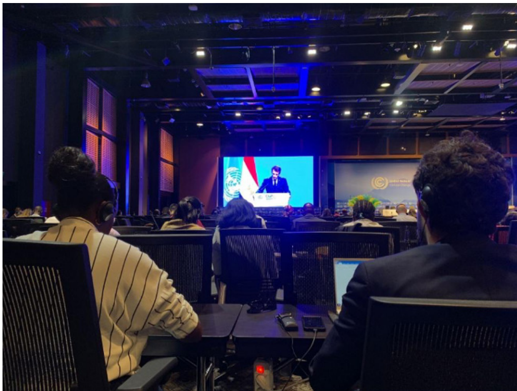
Suivi des négociations de la COP27

Finalement, comme continuation de notre investissement pour inclure les expériences et savoirs des personnes en situation de pauvreté dans les discussions autour du changement climatique, un groupe de jeunes engagé.e.s en Europe et Afrique ont participé à la COP27 à Sharm-el-Sheikh. Dans un effort pour aller vers une justice environnementale étroitement liée à une justice sociale, nous avons porté un plaidoyer pour exiger que personne ne soit laissé de côté dans nos efforts vers une transition écologique au niveau mondial.