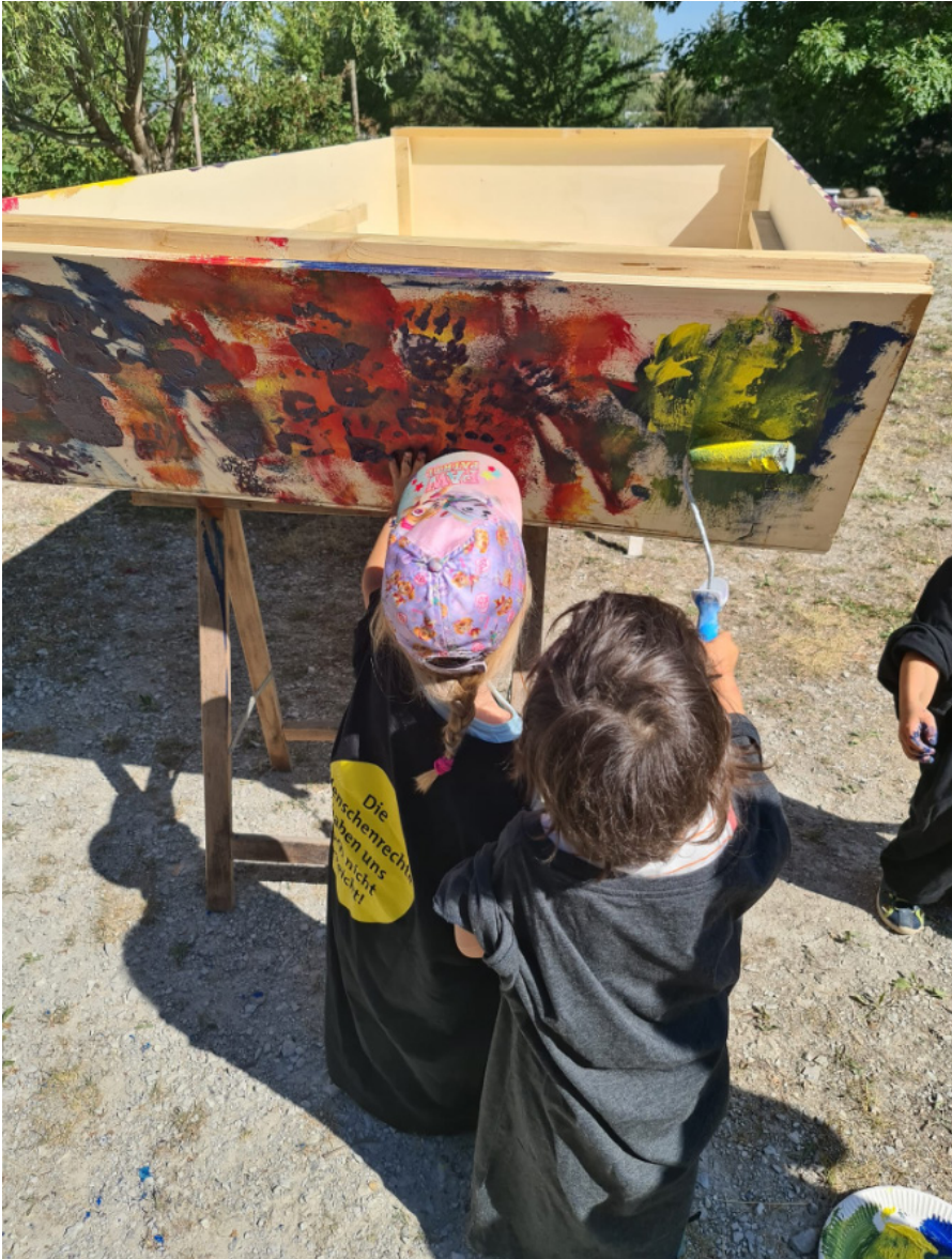
Création d'un bateau durant le séjour familial