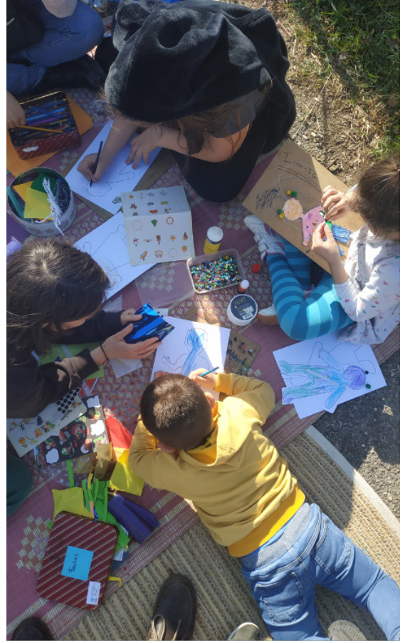
Bricolage et lecture durant la bibliothèque de rue