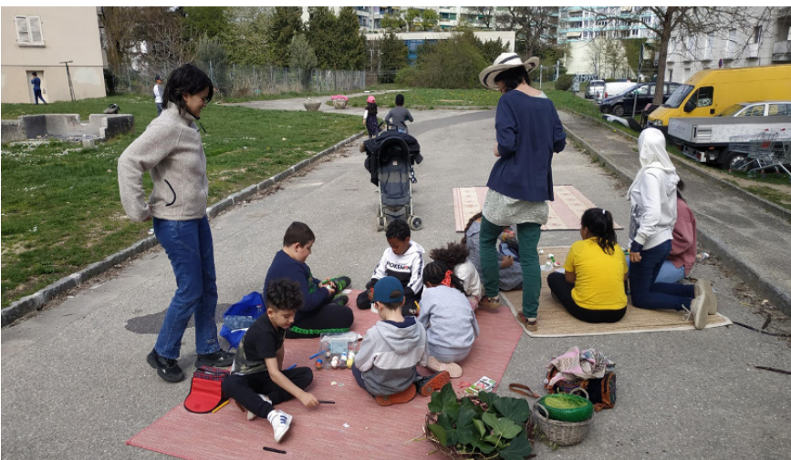
Bibliothèque de rue

Avec les bibliothèques de rue, nous offrons aux enfants et à leur famille un moment où elles et ils peuvent se retrouver ensemble dans le quartier. C'est l'occasion de prendre possession de l'espace commun et d'en faire un usage différent. C'est aussi un temps de partage des savoirs qui répond à la soif de connaissance des enfants, qui les réconcilie avec la joie d'apprendre et les encourage à révéler et à partager leurs talents. L'activité a lieu chaque semaine, le même jour et à la même heure. Les animateurs et les animatrices, les enfants et leur famille peuvent ainsi développer une relation de confiance, où elles et ils s'attendent les un.e.s les autres à se voir et à nous voir: cela est devenu une routine pour nous toutes et tous. Cette régularité permet aux familles de nous faire confiance pour proposer des activités variées aux enfants, entre autres de faire des sorties ponctuelles à la bibliothèque par exemple. Cette relation permet également aux familles de s'impliquer progressivement - certaines sont par exemple venues à la fête d'été d'ATD Quart Monde dans notre Centre national ou à la fête de fin d'année dans notre maison genevoise.