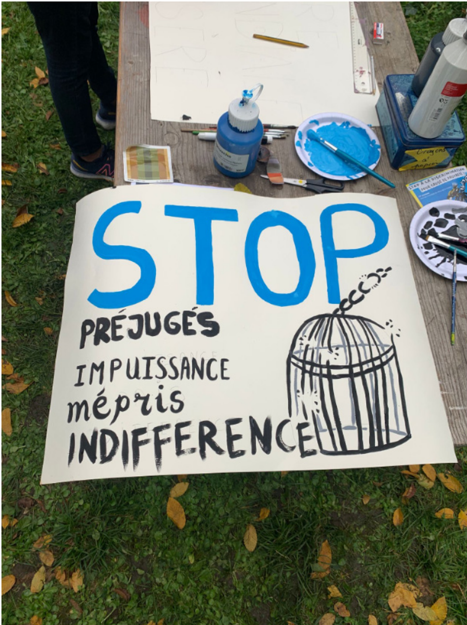
Banderole peinte collectivement pour le 17 octobre