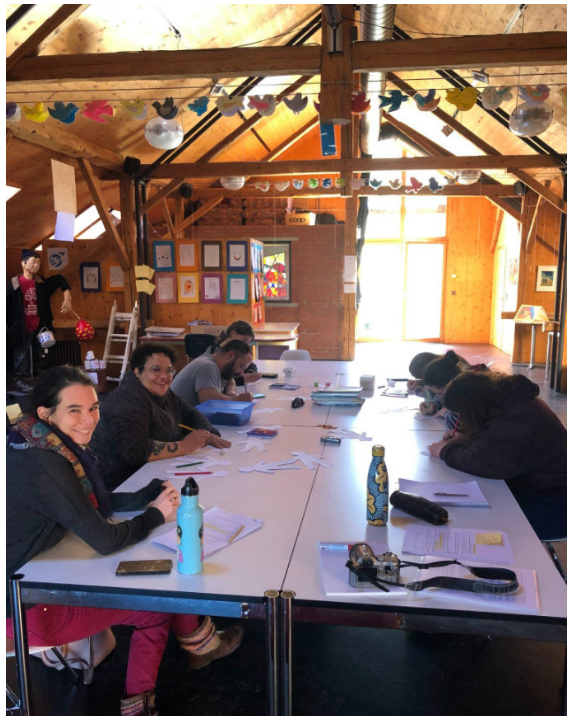
Session de travail du groupe de suisse romande dans notre centre national d'ATD Quart Monde