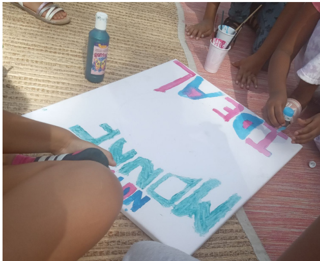
Fresque "Notre monde idéal"

Nous avons également collaboré avec deux étudiantes dans le cadre de leur travail de maturité au collège Voltaire. Avec elles, les enfants ont réalisé des fresques sur le thème du monde idéal, et ont mis des mots sur des photos de leur quartier. Tout ce matériel a été exposé par les enfants au collège Voltaire et le vernissage de l'exposition a été pour nous une occasion de tisser des liens avec des professeur.e.s et des élèves qui sont nos voisin.e.s direct.e.s.