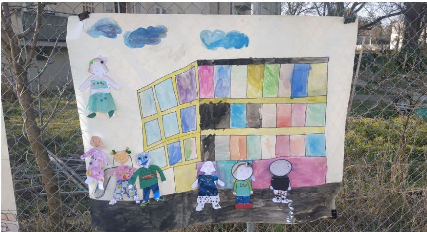
« Notre quartier », réalisé par les enfants de la bibliothèque de rue

C'est ce quotidien partagé avec les personnes qui vivent constamment la violence de la misère qui permet d'agir pour l'accès aux droits humains et de contribuer à la société avec l'expérience et le savoir de chacun et chacune, afin d'être moteur d'un changement durable.