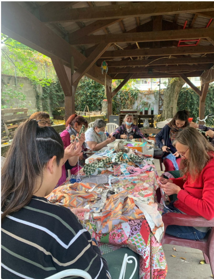
Chantier dédié à la préparation du stand pour le 17 octobre

L'année s'est clôturée en beauté et en collectif à la Maison Quart Monde autour d'une fête de fin d'année le 21 décembre. Chaque pièce de la maison offrait une activité aux personnes qui pouvaient se déplacer à leur guise d'un étage à l'autre. Le tout terminé par un goûter dehors, en dégustant les biscuits de l'atelier cuisine. C'était une fête à l'image de notre Mouvement, où les personnes ayant une longue histoire avec ATD Quart Monde et les personnes nouvellement rencontrées étaient ensemble dans une ambiance intergénérationnelle et bienveillante.