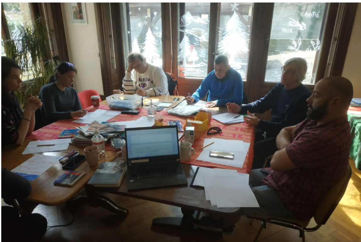
Réunion sur le thème du travail pour le projet pilote de Revenu de Transition Ecologique

La Maison Quart Monde, aussi appelée villa Joseph Wresinski, est un endroit au cœur de notre Mouvement et de son histoire. C'est un endroit de travail pour notre équipe de volontaires permanentes, certes, mais c'est aussi et surtout un lieu de rencontre, de réunion, de création, d'accueil, de visite et d'hébergement pour des visites ponctuelles. Cette maison a toujours été un lieu agréable, où on se sent bien et où on peut se retrouver pour vivre de beaux moments. Où on peut avancer ensemble dans notre combat pour la dignité et la reconnaissance de nos droits.