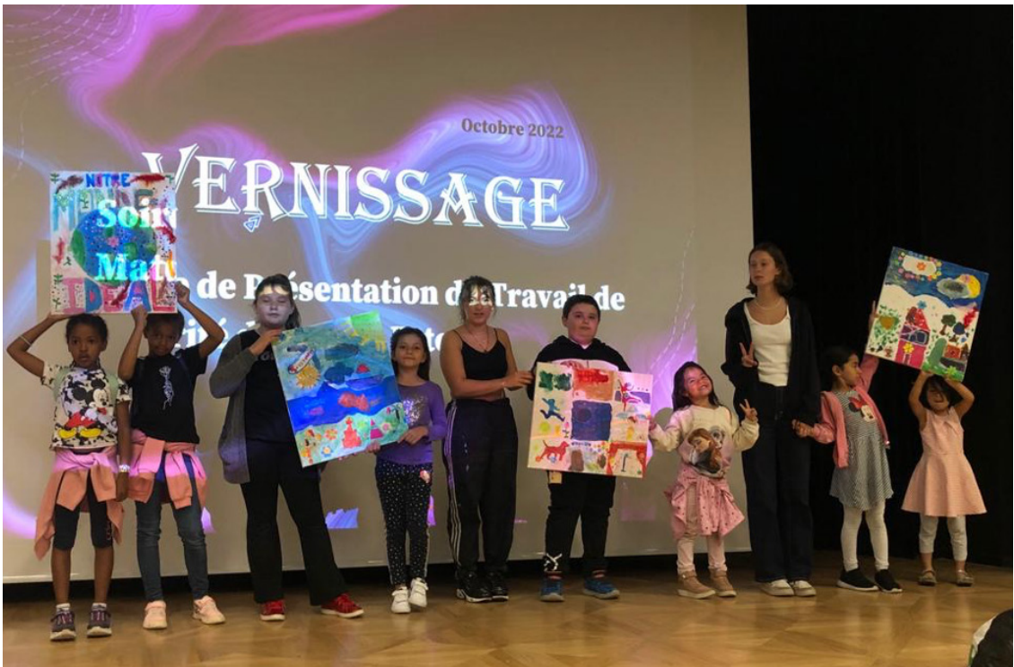
Les enfants au collège voltaire pour l'installation du vernissage de leurs œuvres

18 animateurs et animatrices , pour un total cumulé de 100 présences . Certain.e.s ont participé de manière très régulière, d'autres plus ponctuellement. Six animateurs.trices sont de jeunes adultes de moins de 30 ans. En moyenne, un après-midi de bibliothèque de rue s'écoule sur deux heures et demi . La moitié de ce temps est consacrée aux livres et l'autre moitié à des activités diverses.