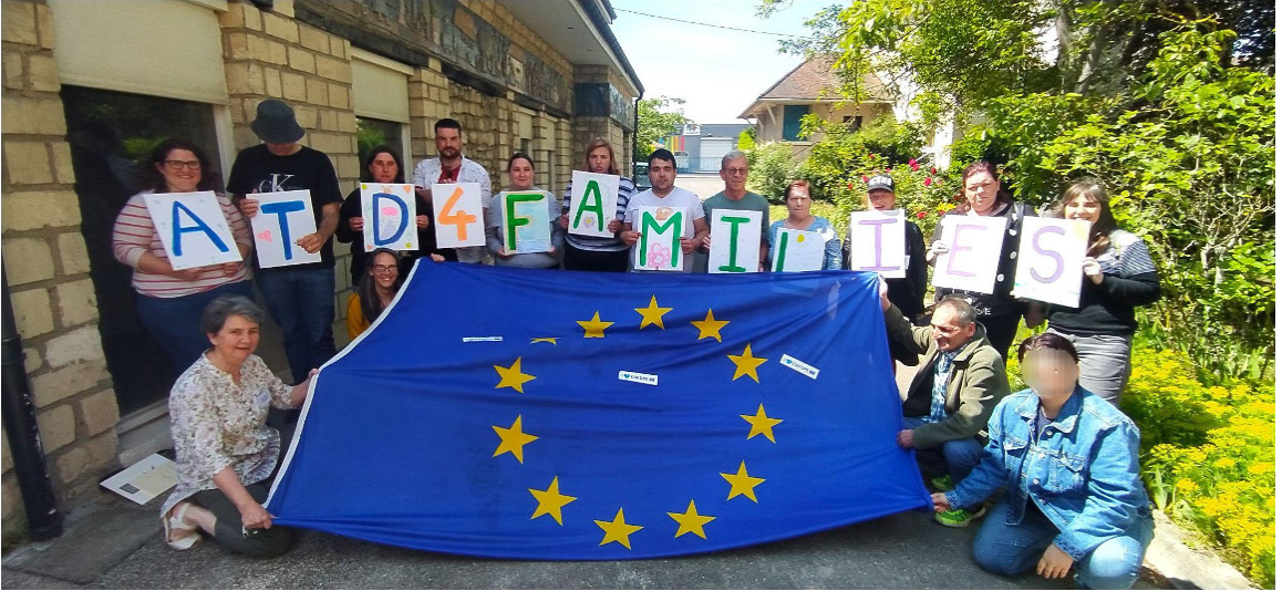
Rencontre européenne du chantier famille au centre international d'ATD Quart Monde