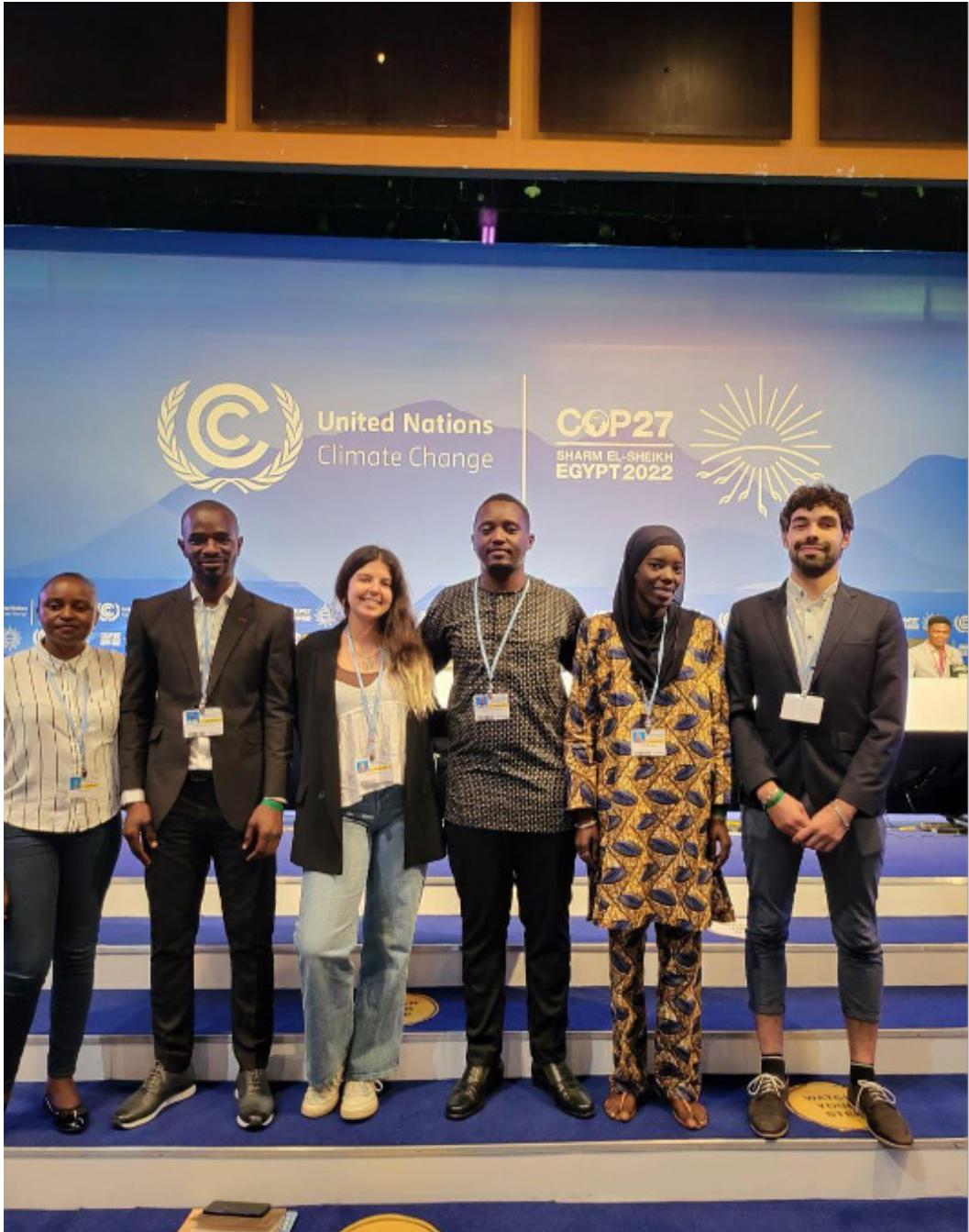
Délégation d'ATD Quart Monde à la COP27