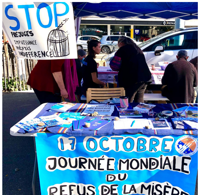
Stand à Plainpalais le samedi 15 octobre